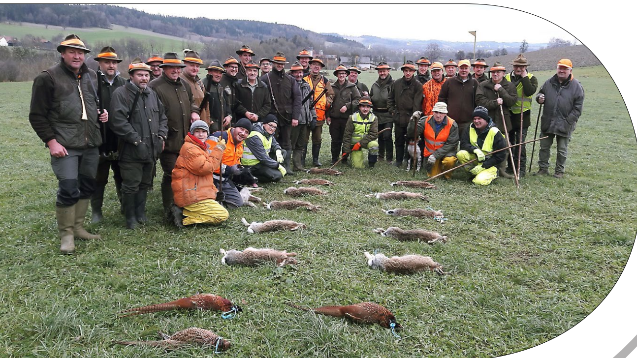
Treibjagd Hehenberg