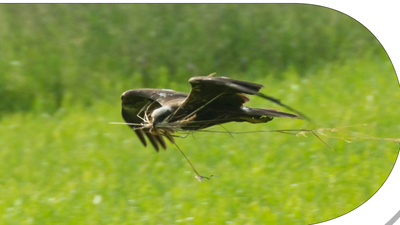
Weihe Weitenfeld