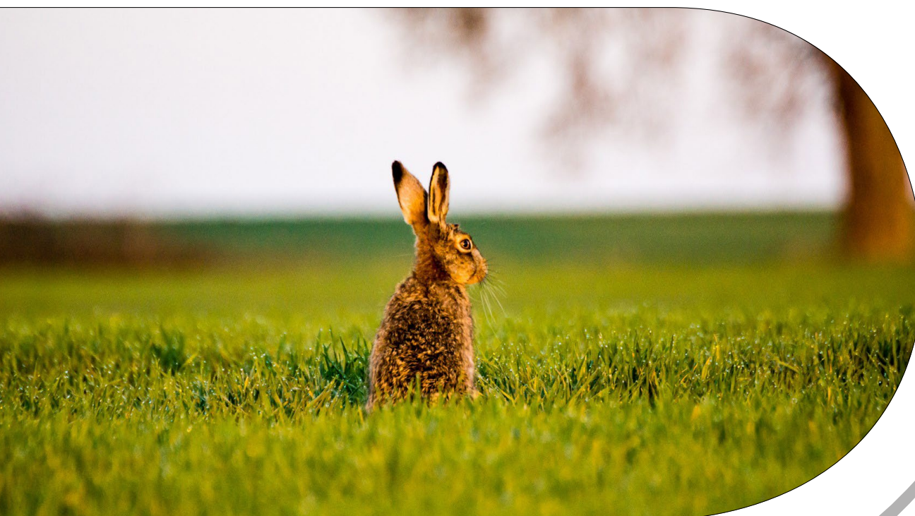
Feldhase Weitenfeld