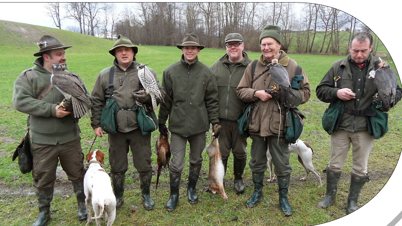
Beizjagd Korntrnberg