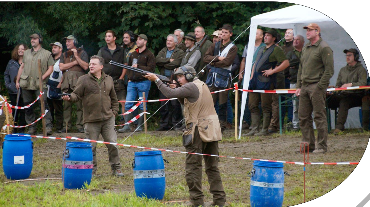
Tontaubenschießen Grubhof, Foto: Trinkfaß Fritz

im September 16. Taufkirchner Kinderferienaktion, Jugendausschuss der Marktgemeinde