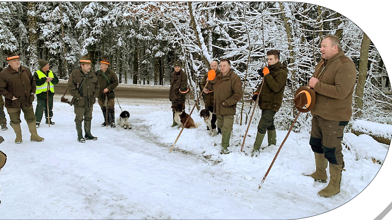
Begrüßung Treibjagd