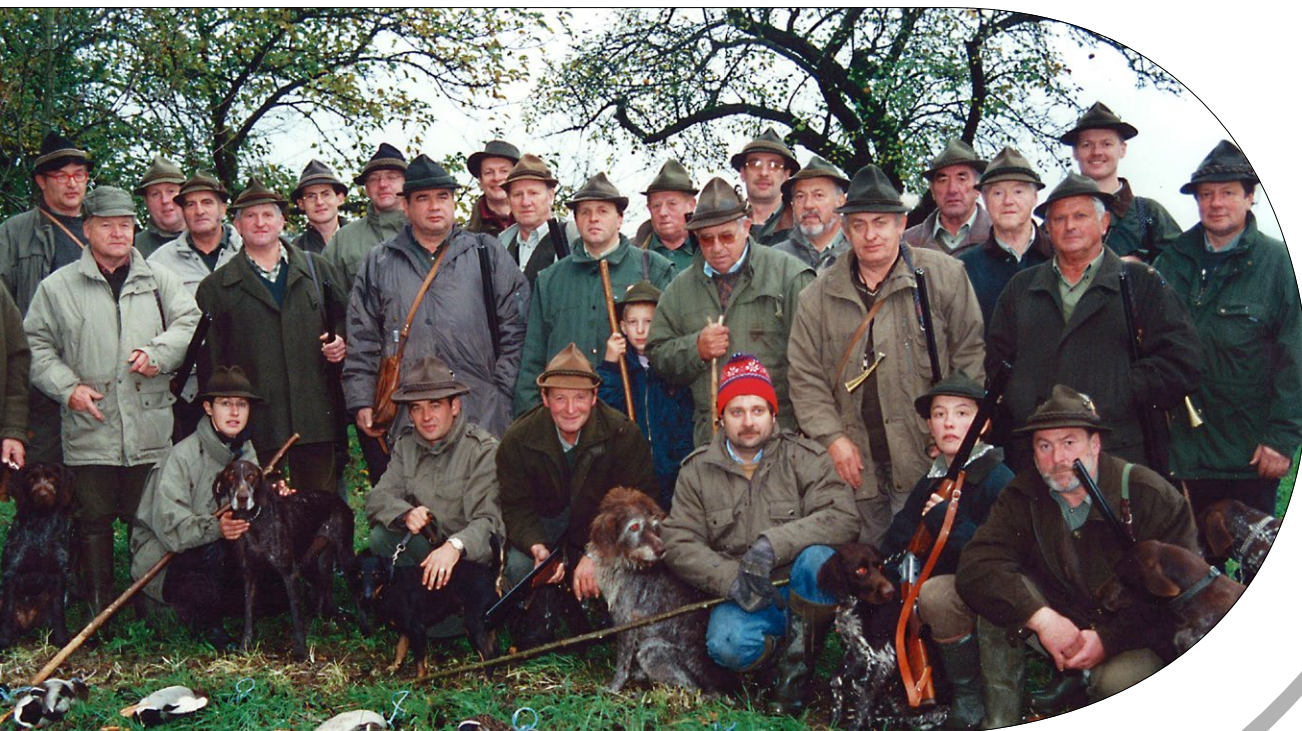
Gruppenbild 2003, Foto: Jägerschaft Taufkirchen