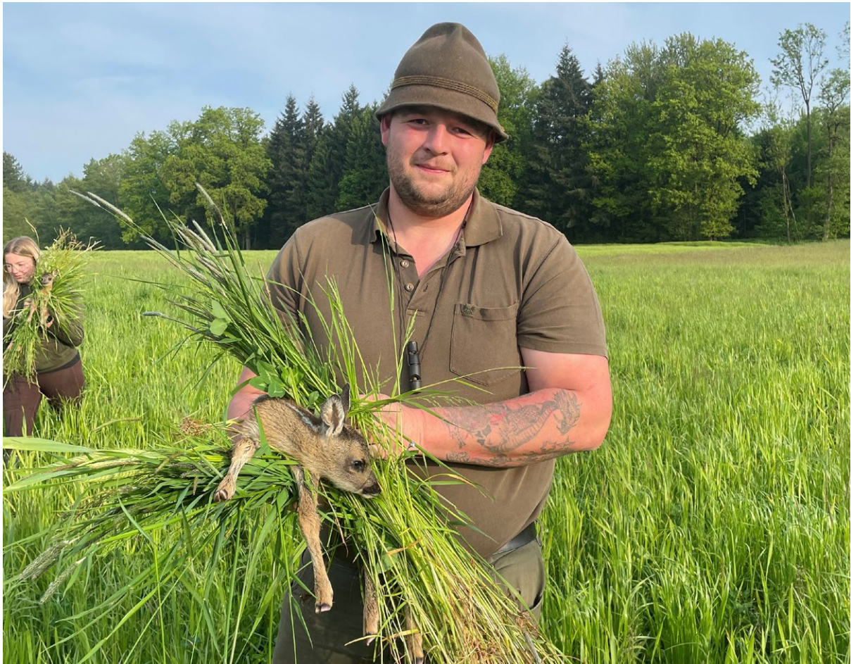
Rehkitzrettung, Foto: Königseder Philipp