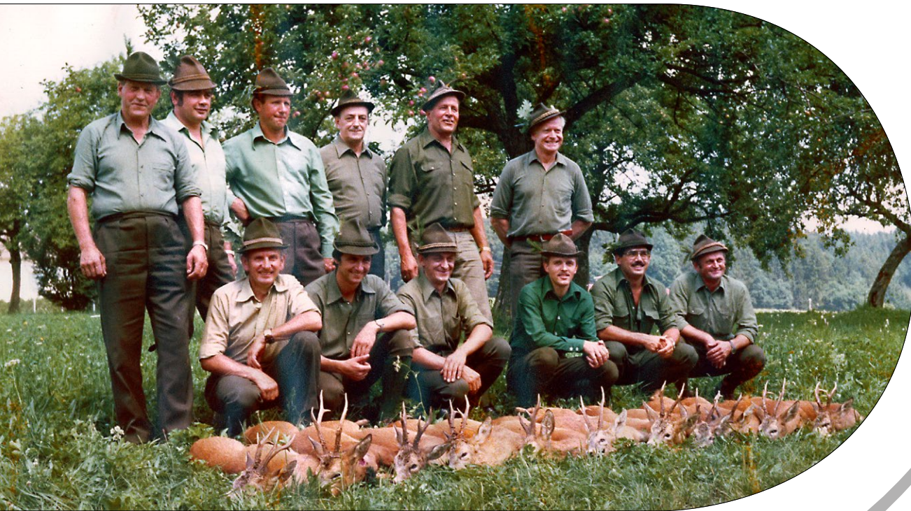
Gruppenbild 1978